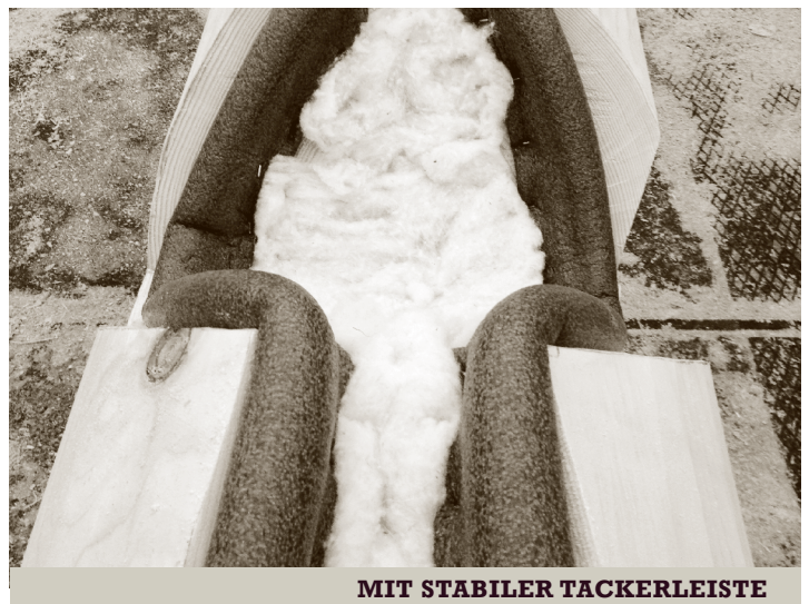
MIT STABILER TACKERLEISTE

Unser selbst entwickeltes Dichtband heißt PECOTACK und ist aus ökologischen Materialien gefertigt. Es lässt sich bequem mit dem Tacker befestigen und ist durch seine optimale Beschaffenheit bei jedem Wetter zu verarbeiten. Das spart Zeit und damit Ihr Geld.